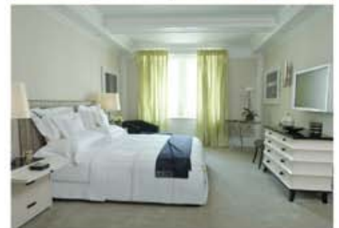
左頁：The Mark由曼哈頓一座歷史地標旅館改建而成。 本頁：（最上）房地產規劃師找來Jean-Philippe Delhomme繪製The Mark頂級生活插畫情境。（相圖）由樣品屋已經可以窺出Jacques Grange每個細節都照顧到的設計魔力。

形象插畫。近幾年曼哈頓豪華建案何其多，The Mark的夢幻團隊相合，卻讓我們見識到當巴黎遇見NYC的美妙異想世界，令人心神嚮往之。